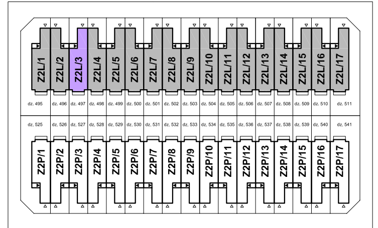
LOKALIZACJA NA PLANIE